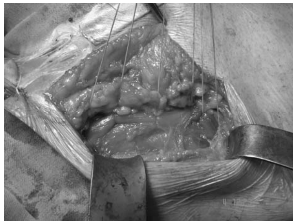
Рис. 3. Окончательный вид операционной раны. Протез полностью покрыт мышечной тканью